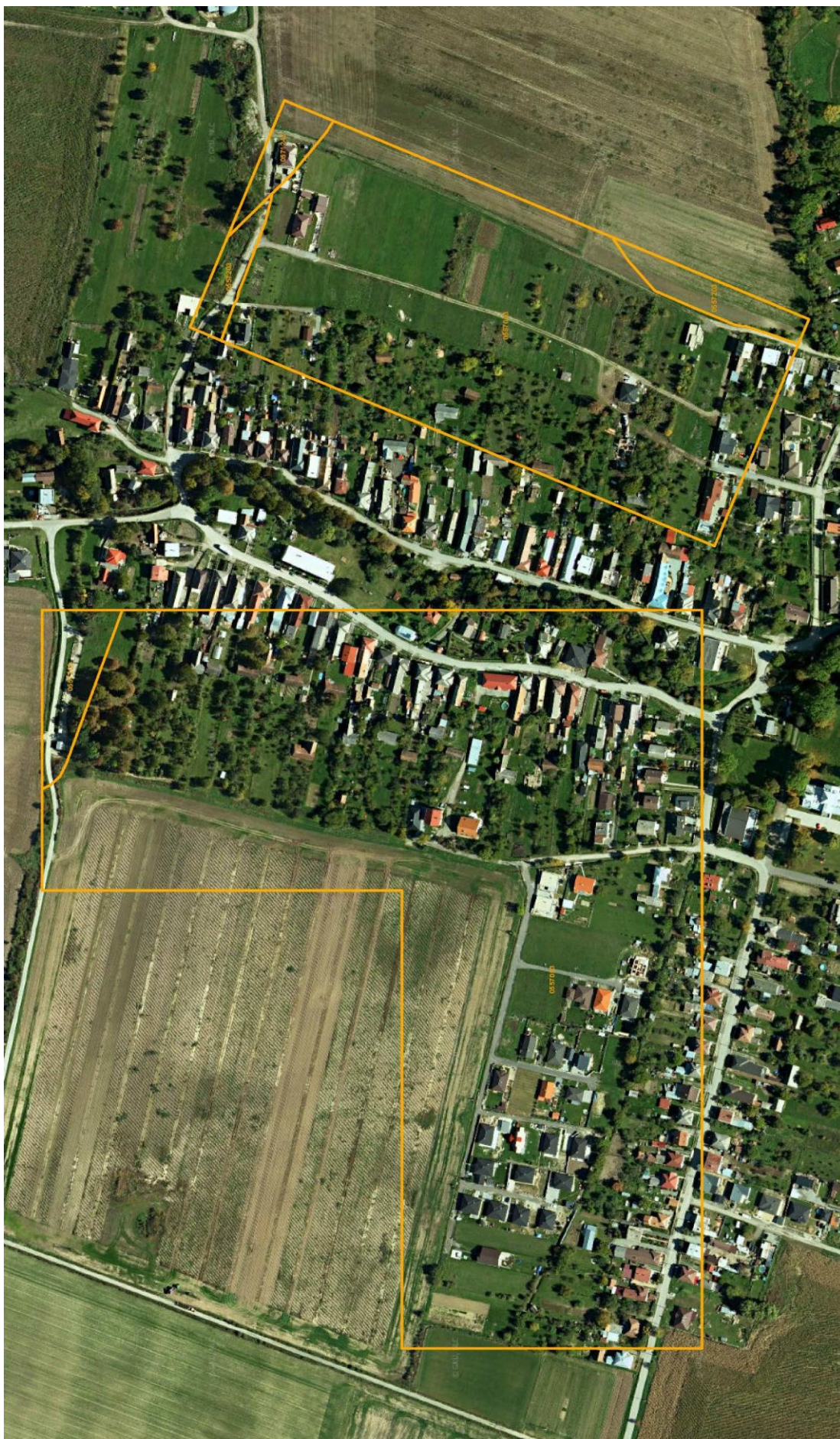
Hranice a kódy BPEJ